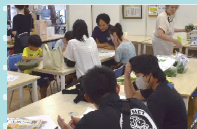
子育て支援・ボランティア