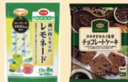
今年度の商品サンプル例