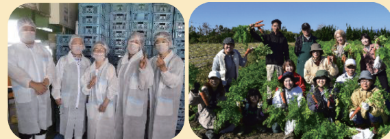
今年度の工場・産地見学の様子