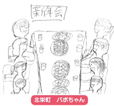
北栄町 バボちゃん

●智頭町 フーさん 春になれば、雪がとけてやると外仕事ができるようになります。夏に向けての種まきや、苗を植えたりしなければいけません。その前に土作りをがんばります。