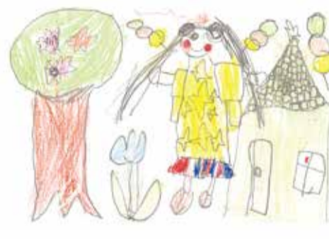
鳥取市 とかげさん

●鳥取市 はははあちゃん 春といえば、節分ですね。お正月が過ぎると豆まきグッズや、恵方巻き、バレンタインフェアも始まってお店が華やかに!!我が家でも子どもたちが小さい頃は、楽しく楽しくやってきたのですが、今は静かなものです。さらに「おたのぼし」「あまんきみ」ことこの絵本に出会ってからは、ますます楽しみました。鬼の子「おたのぼし」よかったです。うちへおいでよ。