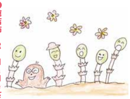
伯耆町 ともちゃん

●倉吉市 ムエツトさん 1日1日が全部自分の自由な日々となり、たくさんやりたいことがあります。今年一年も、新しいことに挑戦してみようと思います。高齢にも負けず!!