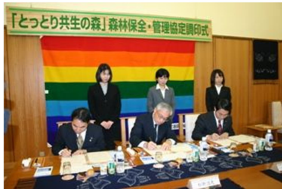
鳥取県・倉吉市・鳥取県生協