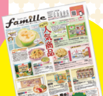
毎週、子育て専門カタログ 「ふあみ〜ゆ」をお届けします。