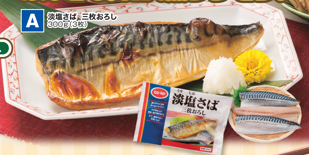
A 淡塩さば 三枚おろし 300g(3枚)