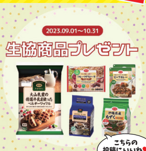
こちらの 投稿にいいね♡ してね