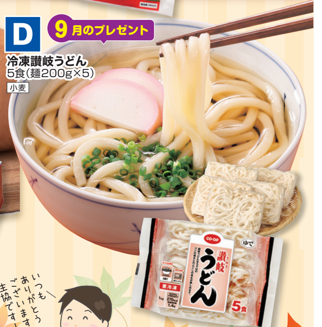
冷凍讃岐うどん 5食(麺200g×5) 小麦