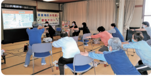
筋肉トレーニング「椅子スクワット」の様子