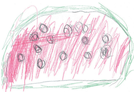
鳥取市 よっしーさん

6月から県外にいた長男が異動で鳥取に戻りました。社会人スタートルは県外でしたが、鳥取に帰って自宅通いになり、お弁当箱も洗って帰ってきたり、色々なことで大人になった息子に毎日感心しています。