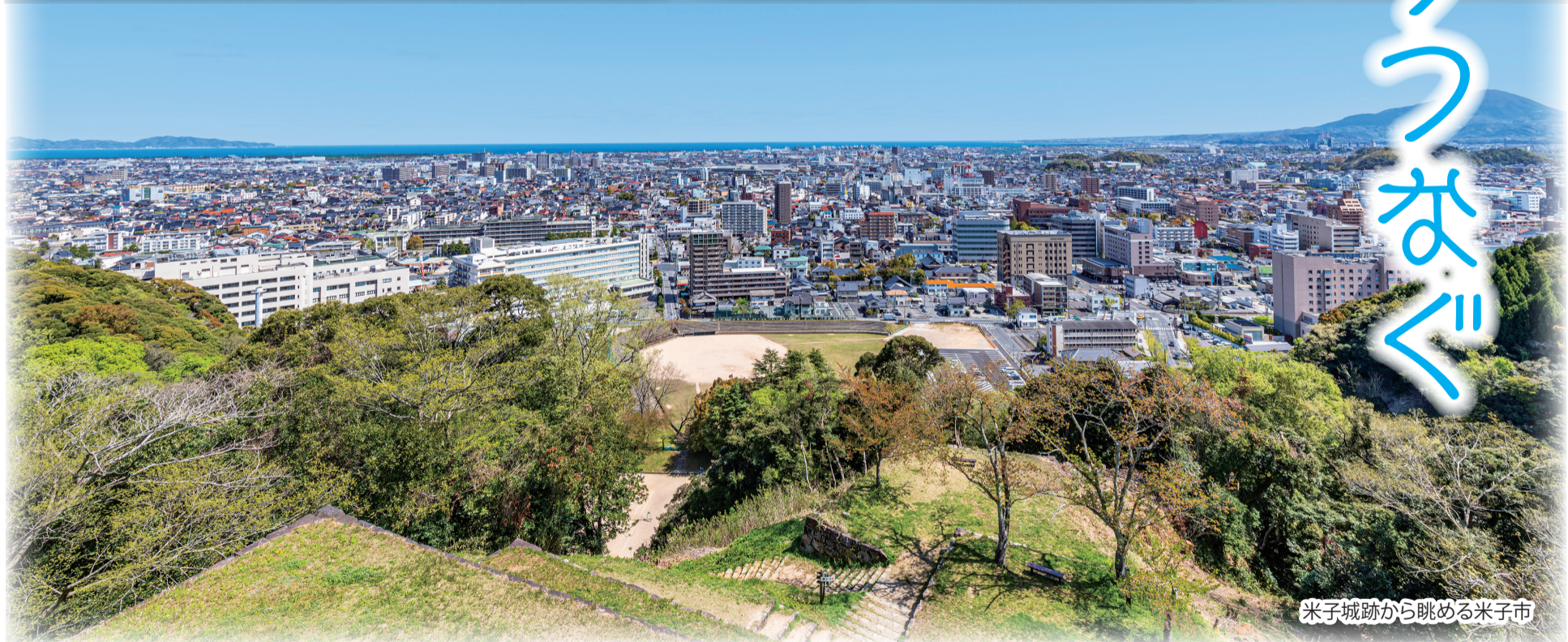
米子城跡から眺める米子市

鳥取県内で起こった事実に向け、当時の状況を知ること、平和を考えるきっかけになるのでしょうか。