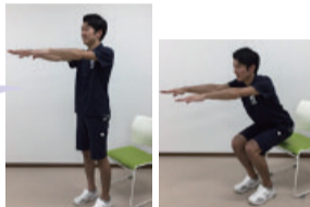
(鳥取医療生協が作成の資料より紹介)