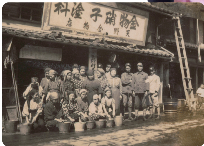
焼夷弾が落ちた時のための消火訓練のようす。男性は戦争に召集されていたので、女性と子ども達を中心に訓練を行ったそう。

当時は琴浦町に住んでいて、4歳だったので戦争の記憶は残っていない。当時17歳で女学生だった姉に聞いた話だと、セーラー服にもんぺ姿で勤勞奉仕や子守をしていて、勉強どころではなかったそう。姉は赤碕駅から米子駅まで毎日通って働いていた。戦後、小学生くらいの時に近所に疎開してきた7人家族は、狭い養蚕場の一部屋に住んでいた。何年後には家族がバラバラになり、戦後は生活が大変なところがたくさんあつた。