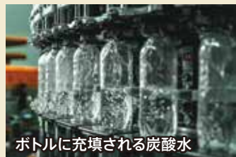
ボトルに充填される炭酸水