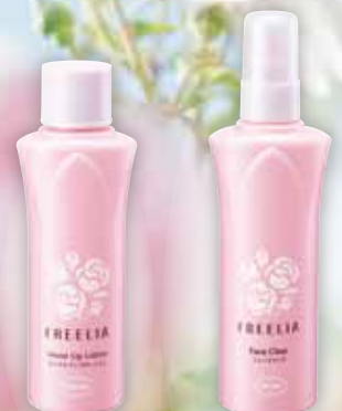
コープフリーリア モイストアップローション 150ml

原料となるバラは、肥沃な土壌と広大な自然が育んだ地下水によって育てられ、もっとも香りが良いとされる八分咲きのバラを毎朝手摘みで収穫しています。肌に使う化粧品原料なので安全面に配慮し、農薬は野菜と同じものを採花後に散布します。製品は、兵庫県三木市のナリス化粧品の自社工場徹底した品質管理のもと製造されています。