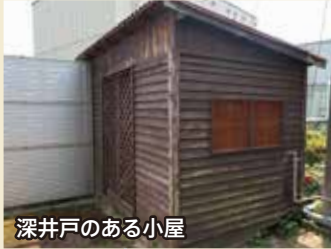
深井戸のある小屋