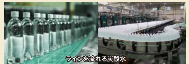
ラインを流れる炭酸水