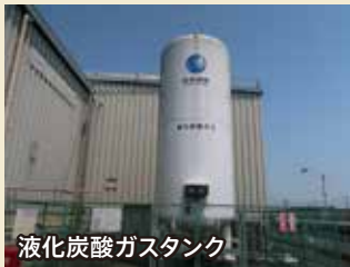
液化炭酸ガスタンク