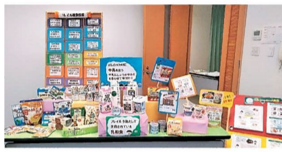
フレイル予防として おすすめの商品