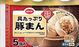
具たっぷり豚まん