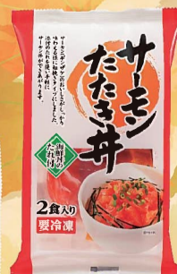
サーモンたたき丼