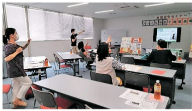
講師と一緒に おすすめの運動を行いました