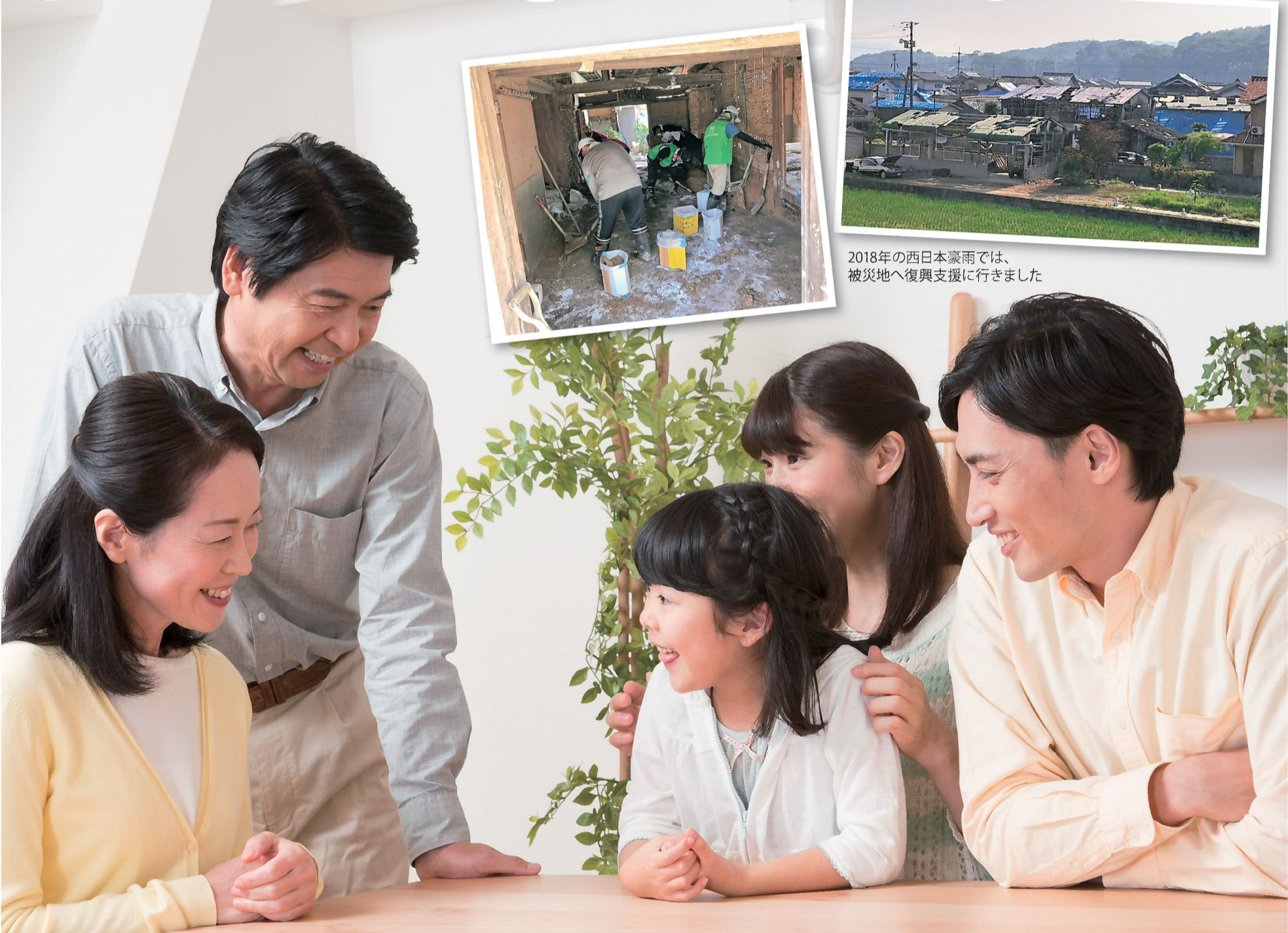
2018年の西日本豪雨では、被災地へ復興支援に行きました